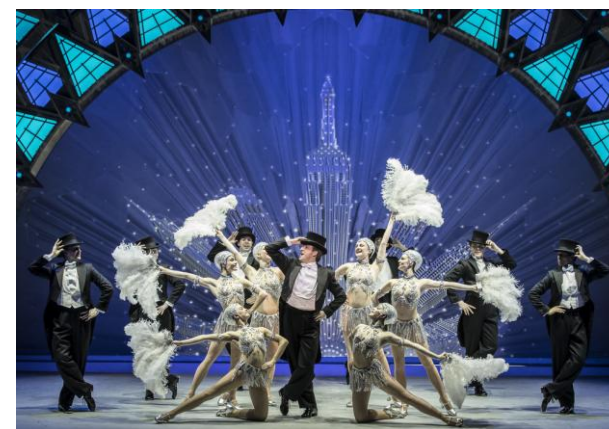
Мюзикл «Американец в Париже»