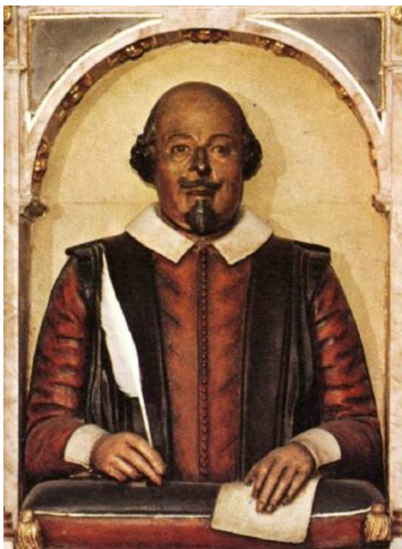
Часть надгробного памятника Шекспиру в церкви Св. Троицы, Стратфорд-на-Эйвоне, Великобритания

ГЦТМ им. А. А. Бахрушина Общество «Друзья большого балета»