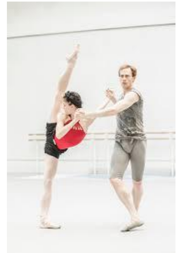
Наталья Осипова и Эдвард Уотсон на репетиции балета «Тетрактис»