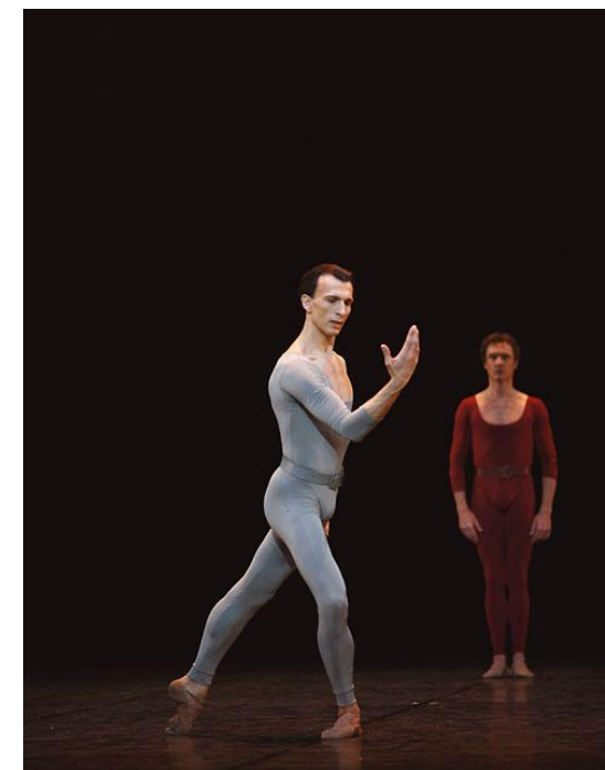
Лоран Илер и Мануэль Легри в балете Мориса Бежара «Песни странствующего подмастерья»