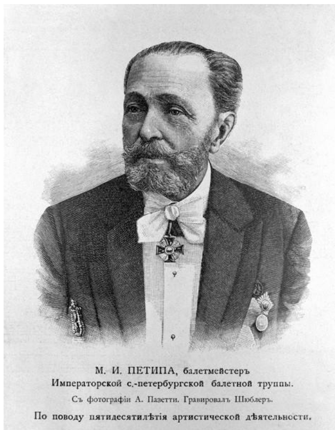
М. И. ПЕТИПА, балетмейстер Императорской с.-петербургской балетной труппы. Съ фотографии А. Пазетти. Гравировалъ Шюблеръ. По поводу пятидесятилѣтня артистической дѣятельности.

Мариус Петипа (11.03.1818 — 1 (14).07.1910)