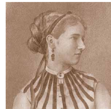
Екатерина Вазем, первая Никия